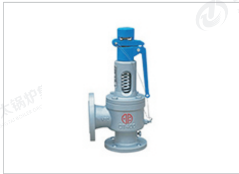
郑州明宇球墨铸铁弹簧全启式安全阀