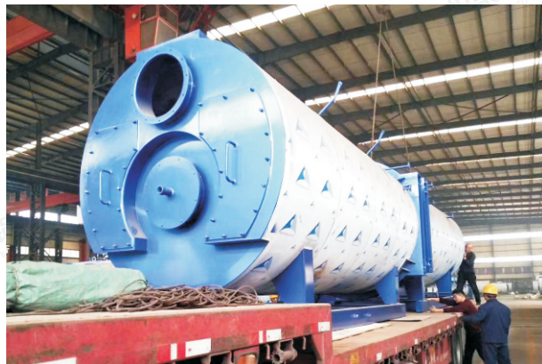
2016.06-8吨 WNS8-1.25-Q 辽宁营口熊岳输变电服务产业开发有限公司