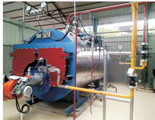
2017.01-7MW WNS7-1.0/95/70-Q 安徽亳州华佗国际中药城有限公司