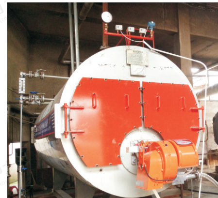
2015.12-14MW WNS14-1.0/115/70-Q 安徽省通源环境节能股份有限公司