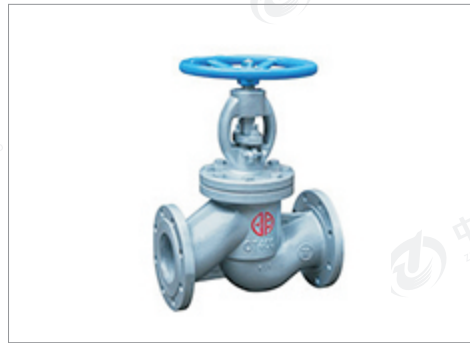
郑州宇明球墨铸铁截止阀