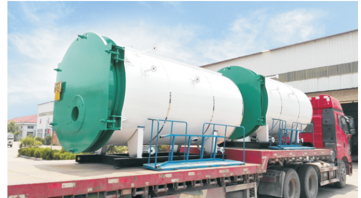
2016.01 -2吨 WNS2-1.25-Q 秦皇岛耀华玻璃工业园有限责任公司