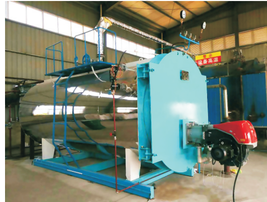
2015.01-0.35MW CWNS0.35-95/70-Q 昆明中国人民武装警察边防部队士官学校