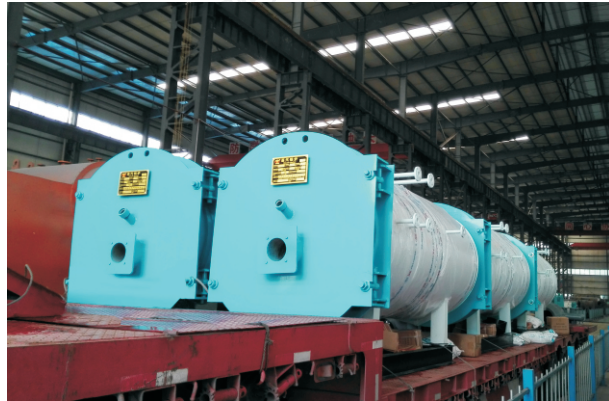
2014.11-0.7MW CWNS0.7-95/70-Q 河南漯河市许慎宾馆